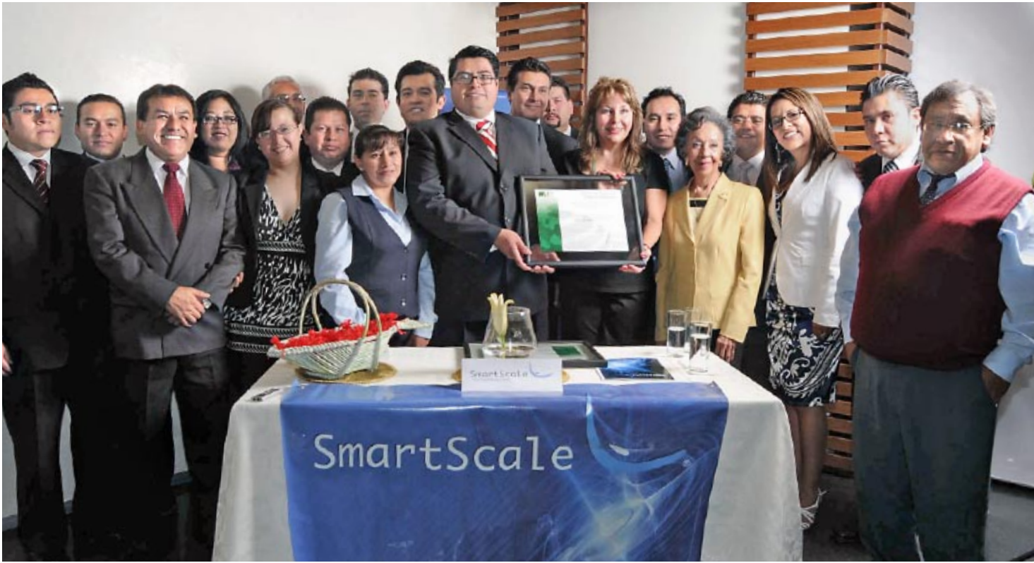
Los que conforman Smart Scale se mostraron felices por la certificación.