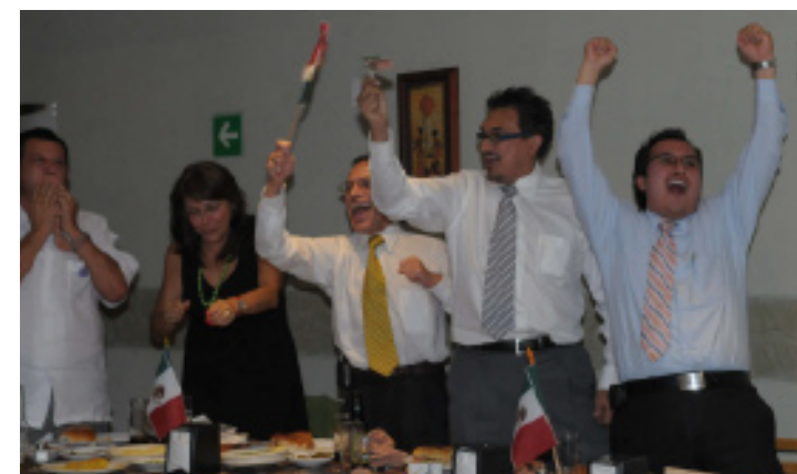
Los goles animaron el encuentro.