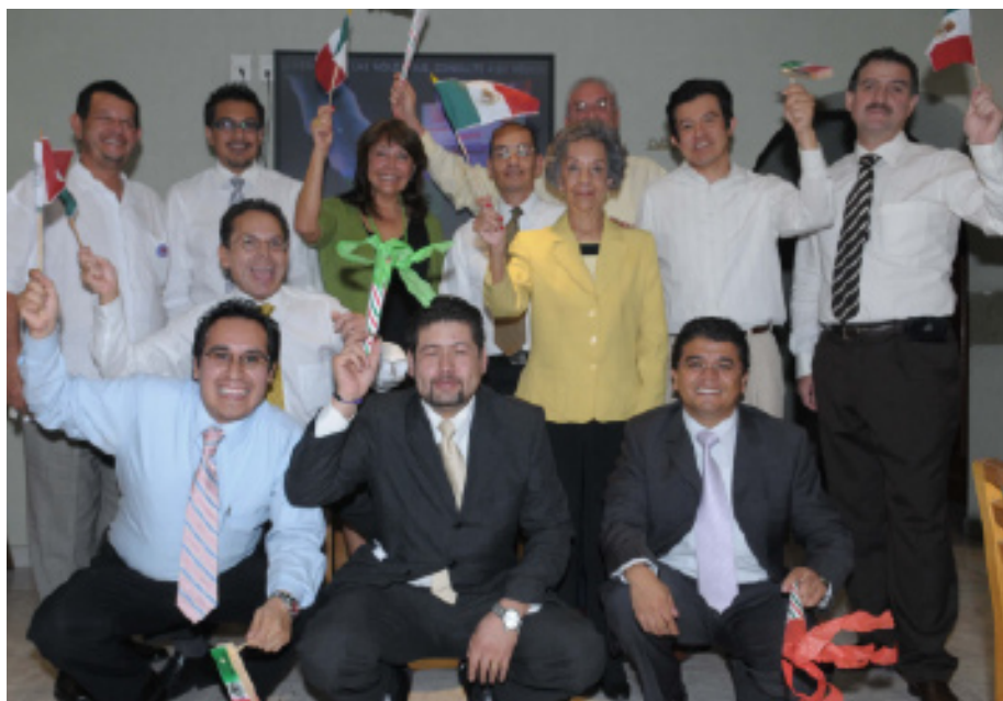
Smart Scale recibió y atendió bien a todos sus amigos y clientes.