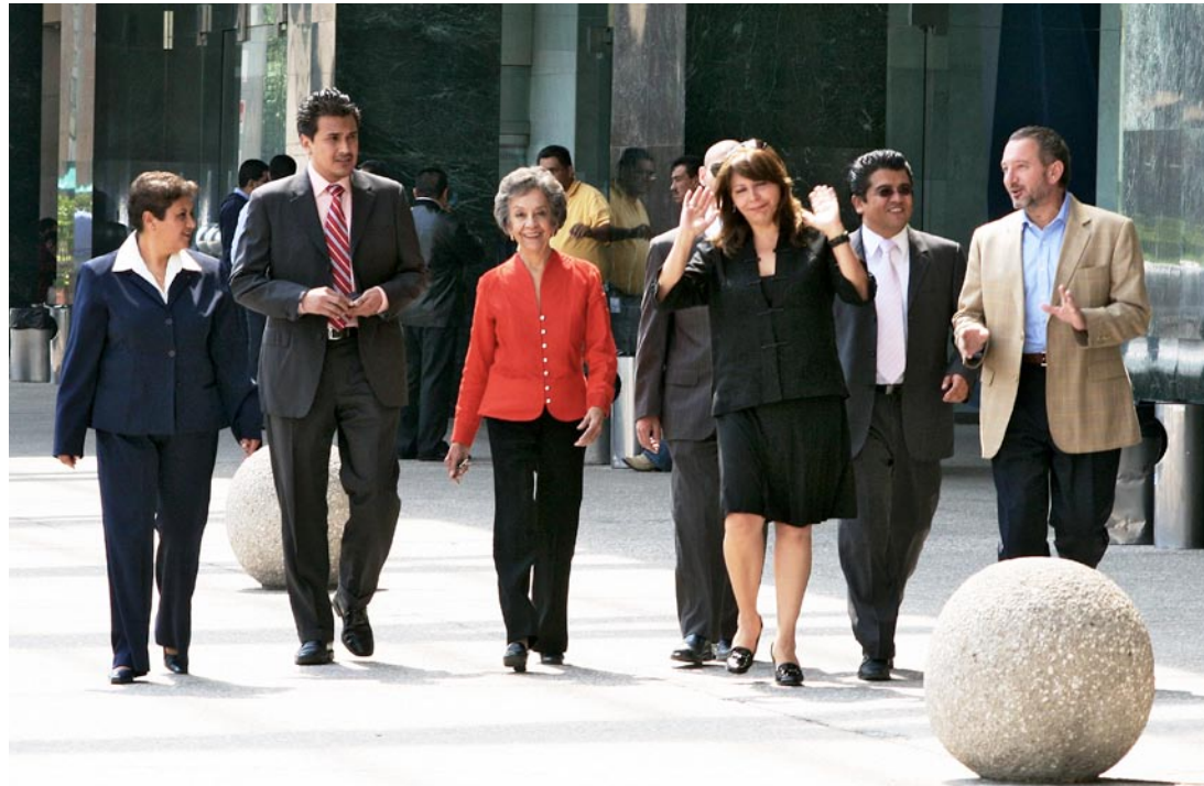
El equipo de Smart Scale.

A lo largo de este primer año la empresa ha dado muestras de su fortaleza y sobre todo, de su voluntad y entrega para convertirse en líder de su ámbito