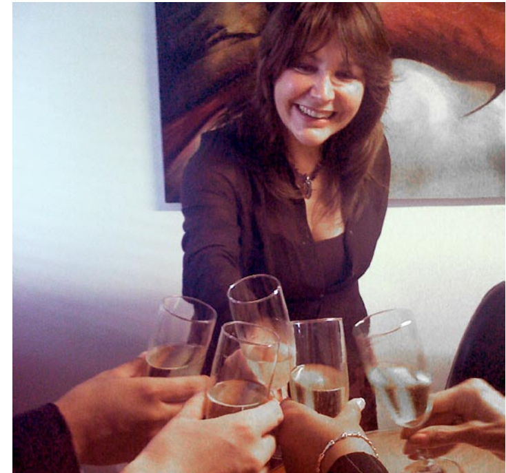
En Smart Scale brindan por el éxito.

En la empresa confían plenamente en que seguirán cosechando logros en los años venideros.